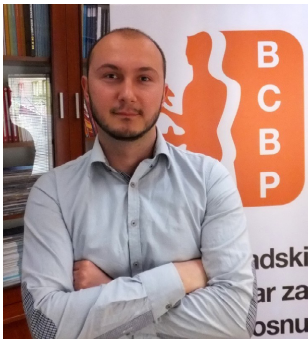
Foto: Beogradski centar za bezbednosnu politiku (BCBP) Bojan Elek, istraživač BCBP-a

Pred očekivano otvaranje pregovora sa EU o novim poglavljima krajem juna ove godine, vredelo bi se osvrnuti na ono šta je Srbija do sada uradila u cilju usklađivanja sa evropskim standardima u oblasti pravde, slobode i bezbednosti (Poglavlje 24). Za bilten „Progovori o pregovorima” piše Bojan Elek, Beogradski centar za bezbednosnu politiku (BCBP)/koalicija „prEUgovor”/Nacionalni konvent o EU – radna grupa za poglavlju 24.